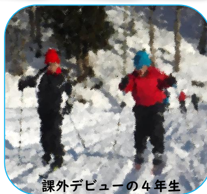
課外デビューの4年生