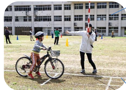
しっかり確認したね