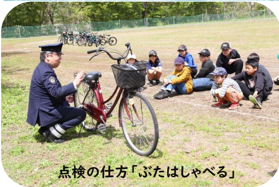
点検の仕方「ぶたはしゃべる」

数年ぶりに、グラウンドで正しい自転車の乗り方を学ぶことができました。教えてくださった皆様、ご協力ありがとうございました。