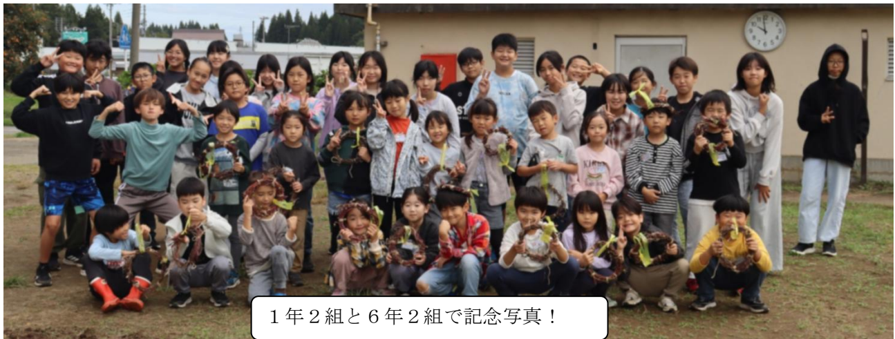
1年2組と6年2組で記念写真！