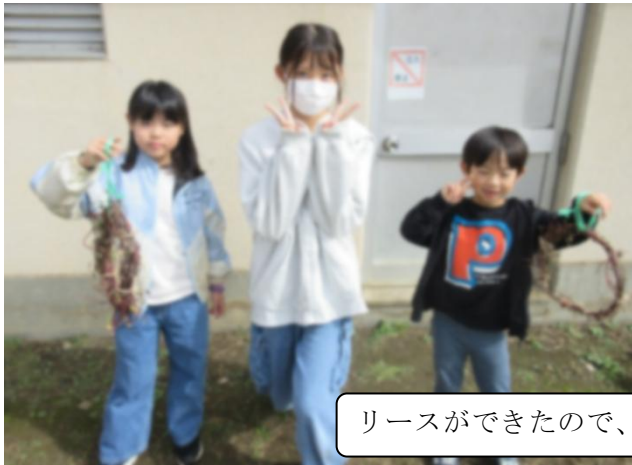
リースができたので、6年生と記念写真