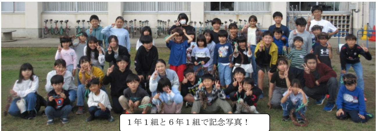
1年1組と6年1組で記念写真！

今週は、今まで育ててきた「アサガオのつる」を巻いて、リース作りをしました。1年生だけだと難しいので、縦割り班の6年生に協力をしてもらいました。6年生に手伝ってもらって1年生の様子を見ていると、とてもうれしそうな姿が見られました。このリースは、教室の廊下に掲示しているので、学校にお寄りの際は、見てください。ちなみに、12月にこのリースを更に良い物にする予定です。ぜひ、ご期待ください！